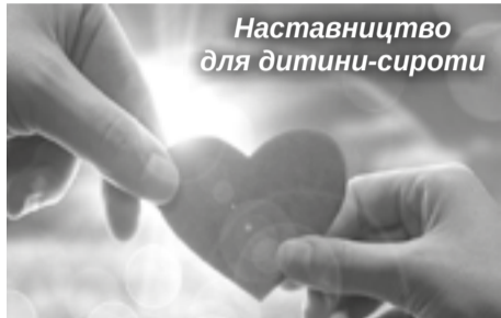
Наставництво для дитини-сироти

Подарувати їм бажане відчуття потрібності й уваги та допомогти знайти «свого» дорослого друга покликаний проект «Наставництво». З 2015 року цей проект реалізує в нашому місті Комісія у справах родини УГКЦ.