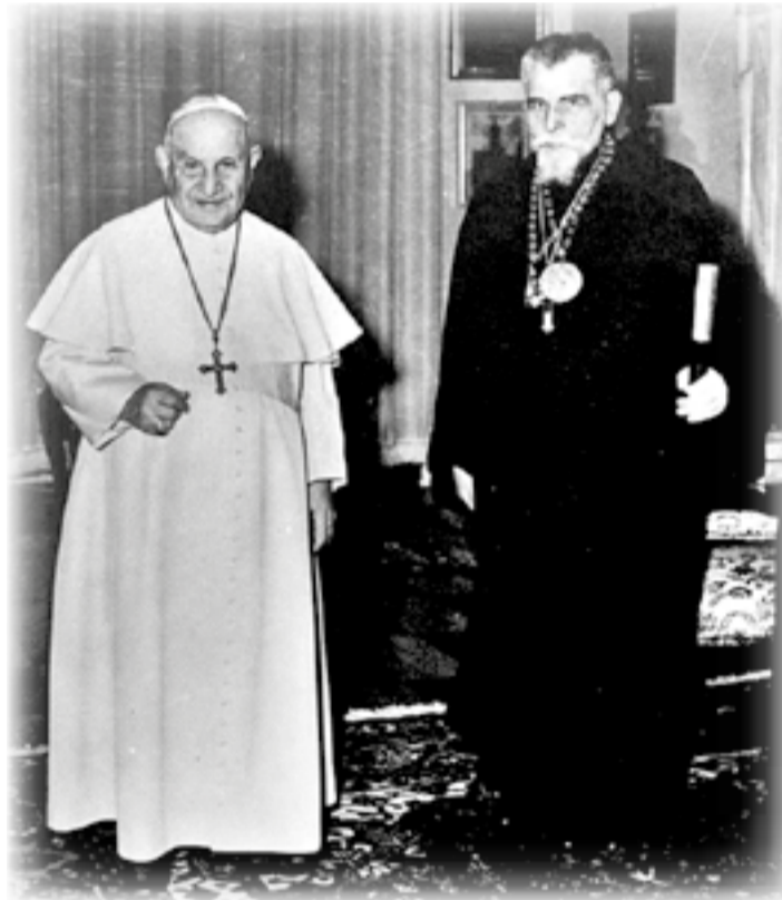
Патріарх Йосиф Сліпий та Папа Римський Іван XXIII

Патріарх своїми заявами, своєю самою присутністю, не одному єпископові на Соборі, не одному членові богопосвячених згромаджень та не одному мирянину, що за залізною куртиною безбожна комуністична влада нищить храми, закриває, а то й перебудовує їх на танцювальні салони, кінозали, склади, посилає вірян на Сибір за свою віру! Захід, чесно кажучи, не був зовсім ознайомлений з реаліями в Радянському Союзі! Вони вірили, що там рай, що там живуть добре, навіть краще, як у них. Дуже мало відомостей діставалося на Захід про Союз, а те, що їм було відомо, вони черпали із пропаганди компартій у своїх країнах. Скільки разів, коли я